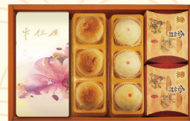
A-3 NT$726 黃金酥 3入/松子酥 3入 杏仁酥 2盒/牛軋糖 三選一