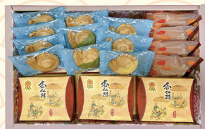
A-2 NT$664 杏仁酥3入 小蝸牛酥10入 紅酒桂圓酥4入