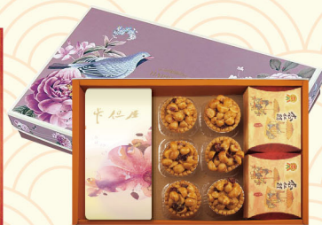
A-1 NT$756 夏威夷果仁塔 6入 杏仁酥 2盒/牛軋糖 三選一