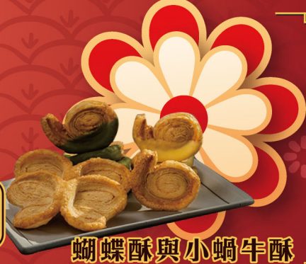
蝴蝶酥與小蝸牛酥